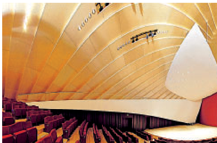
Ein Beispiel aus der gemeinsamen Bearbeitung von Großprojekten: Die neue Philharmonie in Luxemburg