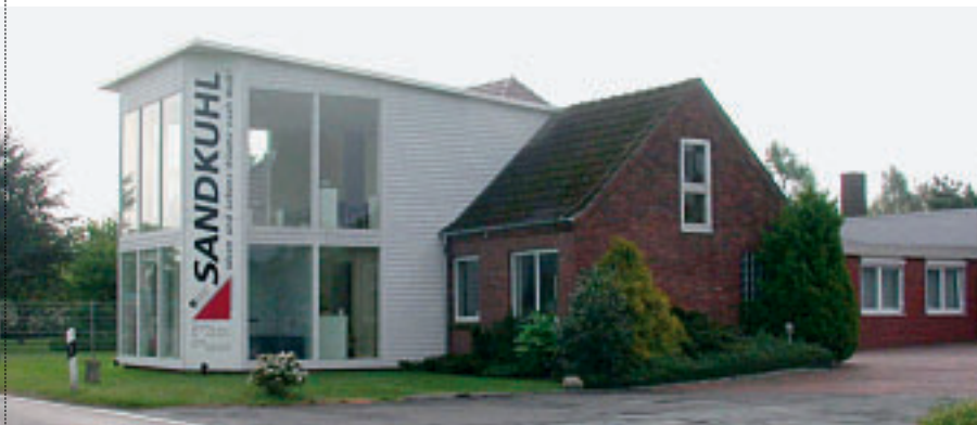
Bei Sandkuhl in Ganderkesee: Kooperation als Erlebniswelt auf 400 m²

www.sandkuhl-gmbh.de www.kathmann-bau.de