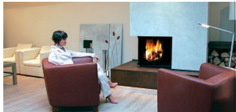
Alles aus einer Hand: Geboten werden hochwertige Ausbau- und Einrichtungslösungen inklusive individueller Beratung und detaillierter Planung