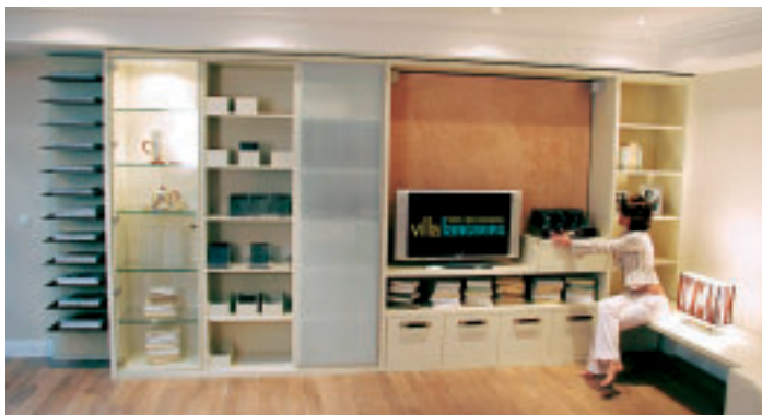
Unter der Marke „Villa Langberg“ haben sich zwölf namhafte Firmen aus dem Raum Hamburg zusammengetan