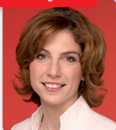
Sabine Bätzing MdB

Im Juni 2008 startete mit dem Wettbewerb „Unser Betrieb macht rauchfrei!“ zum ersten Mal in Deutschland eine bundesweite Aktion zur Förderung des Nichtrauchens, die sich ausschließlich an kleine und mittlere Unternehmen richtete.